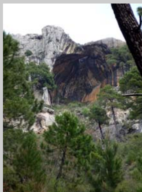
Iglesia de Los Perros