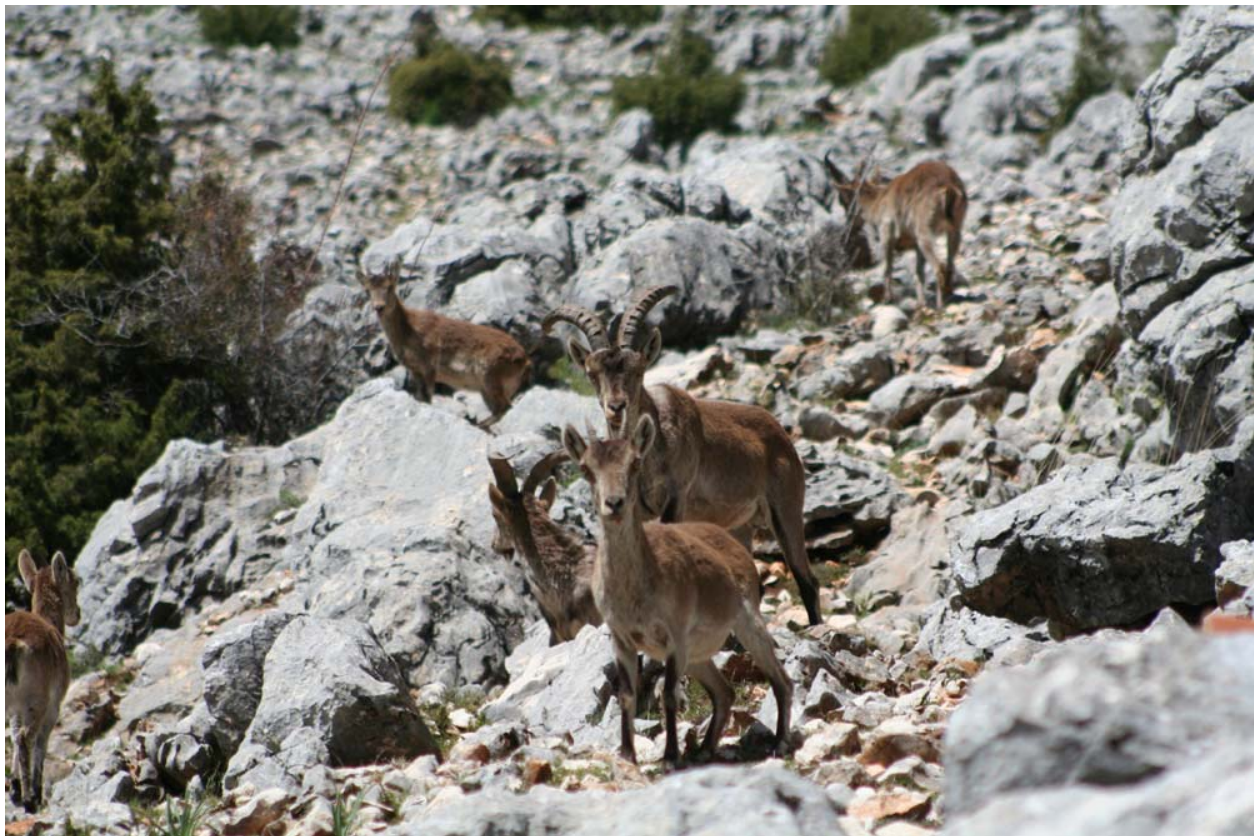
Cabras Montesas en La Albarda

Áreas de recreo: A 1 km. del inicio del sendero en dirección Mogón (Villacarrillo), se encuentra la Zona de Acampada Controlada ZAC Fuente de los Cerezos. A 6 km. del inicio del sendero en dirección Villanueva del Arzobispo, se encuentra el Área Recreativa del Charco del Aceite.