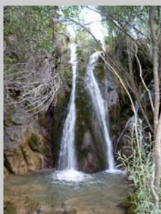
Salto de Agua Arroyo Raso de la Honguera