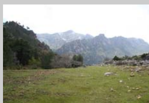
Raso de la Honguera