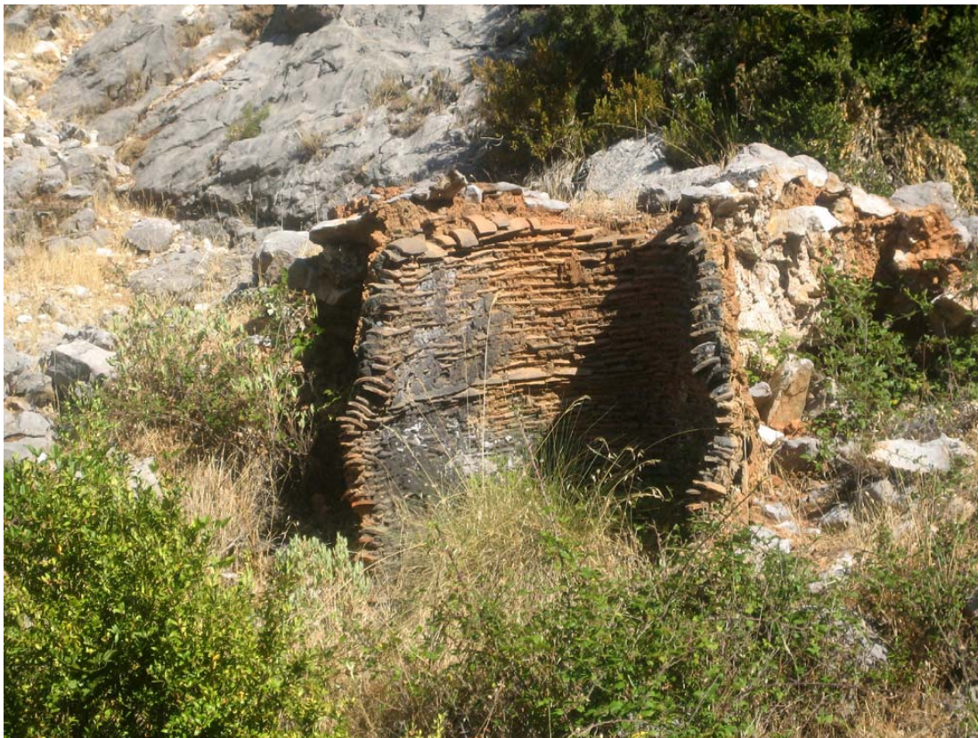
Merera del Raso de la Honguera

Cuadros que destacan algún punto interesante en la ruta: Río Aguascebas Grande con sus aguas cristalinas, área recreativa de la Cueva del Peinero, pequeña cascada del arroyo Raso de la Honguera, cerrada del arroyo Raso de la Honguera, abrigo en el barranco del arroyo del Raso de la Honguera, Raso de la Honguera, la Merera y ruinas del cortijo Raso de la Honguera.