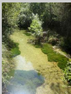
Río Aguascebas Grande