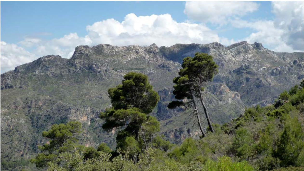
Picos La Veleta, Las Culebras y Las Grajas

Áreas de recreo: A 3 km. del inicio del sendero en dirección Villanueva del Arzobispo, se encuentra el Área Recreativa del Charco del Aceite.