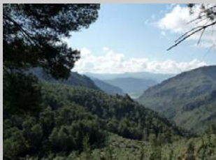
Valle del Guadalquivir y El Tranco al fondo