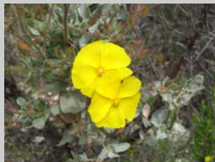
Flor de la Jara