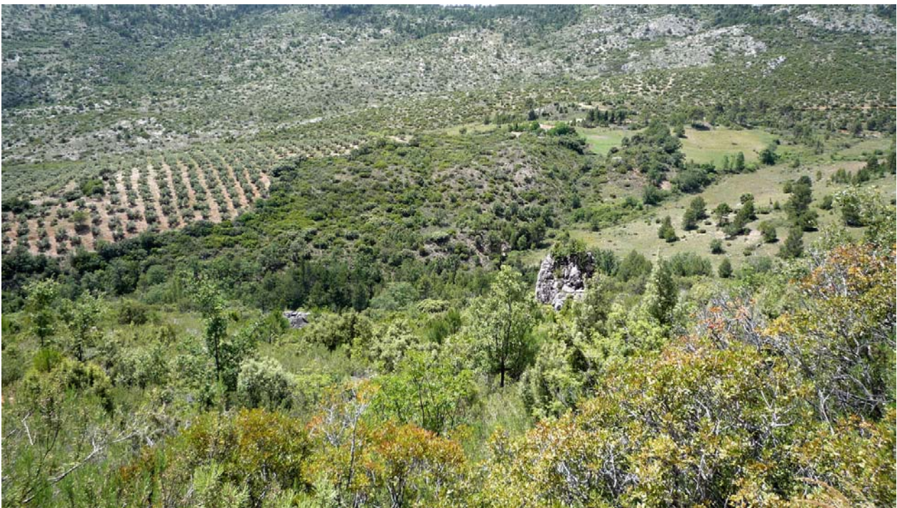
Panorámica de la Cañada de Los Caballeros

Bifurcación de caminos, cogeremos el de la izquierda de forma descendente. Desde esta posición privilegiada obtenemos impresionantes vistas del pico El Cubo, El Hoyacillo y El Caballo Torraso hacia el sur. En el kilómetro 14,9 nos encontramos a la derecha las ruinas de un cortijo en una semi-llanura despejada. A 100 metros más nos encontramos con una fuente y algunos manantiales de agua en las inmediaciones.