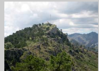
Risca del Quijarrón