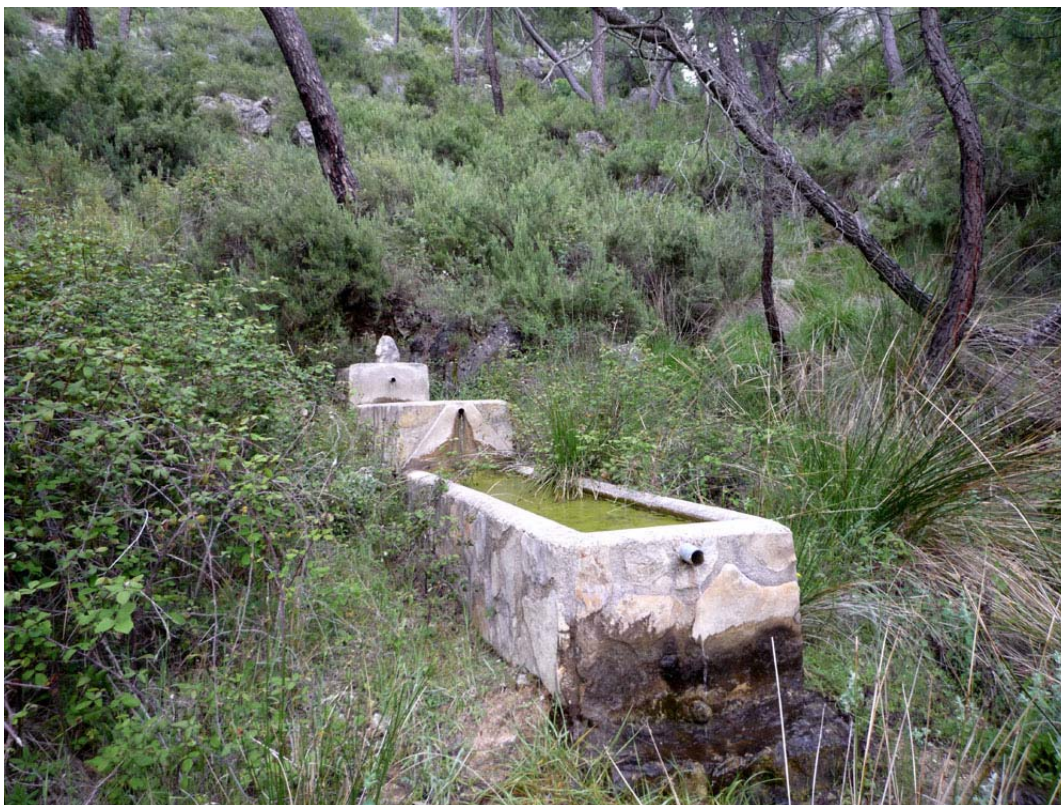
Fuente Arroyo Goyete

Situados en un zigzag que dibuja la pista podemos divisar a nuestra izquierda y al otro lado del arroyo varias casas más derruidas en la zona de Los Mansegosos. Aquí sale un carril secundario al frente que nos llevaría a estas ruinas, seguiremos por la pista más transitada haciendo el zigzag antes mencionado. A partir de este punto la pista se observa muy deteriorada comenzando un ascenso pronunciado.