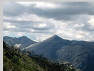
Caballo Torraso y Hoyacillo