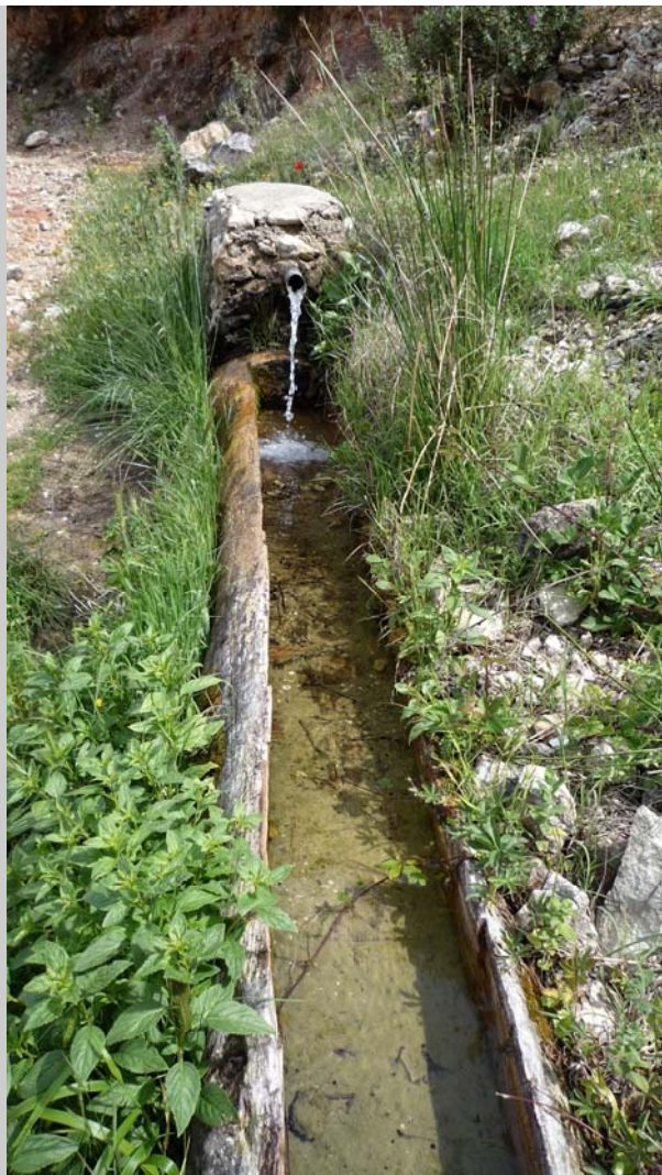
Fuente y Abrevadero de El Bigarral

Caseta de vigilancia contra incendios del Cerro de Santa María, las vistas son impresionantes, desde esta posición se controla buena parte del noroeste del Parque Natural de las sierras de Cazorla, Segura y Las Villas. En la cima encontramos vegetación de tipo mediterráneo así como Hinojos, Viola Cazorlensis y Sabinas, entre huellas de cabras montesas que habitan estas alturas.