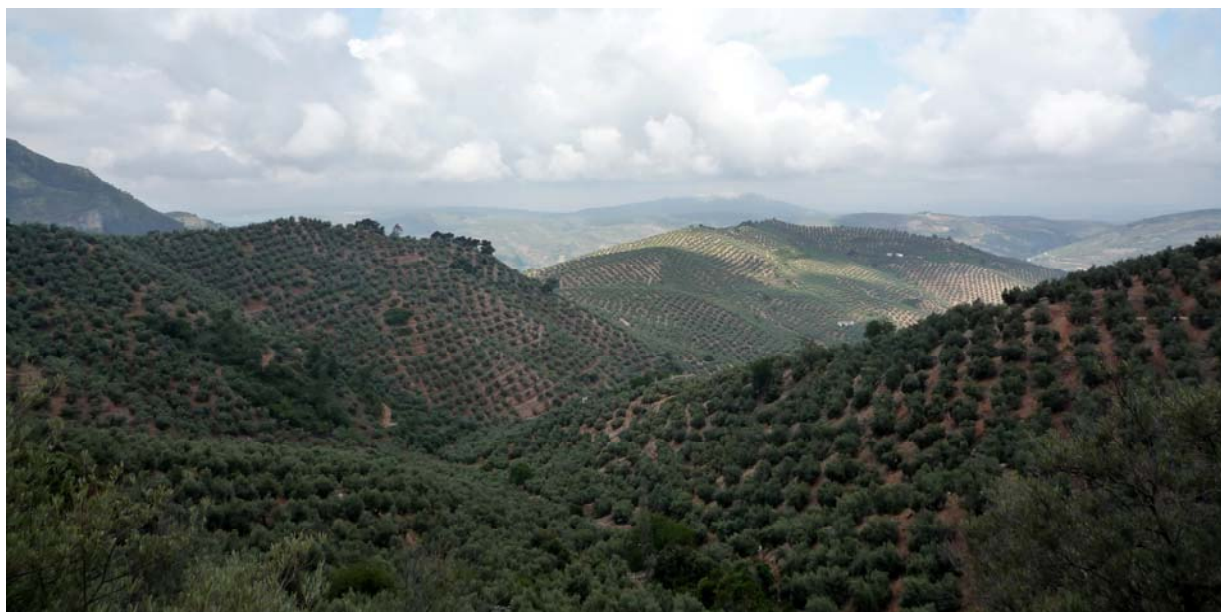
Olivares Serranos en el Barranco de Los Lobos