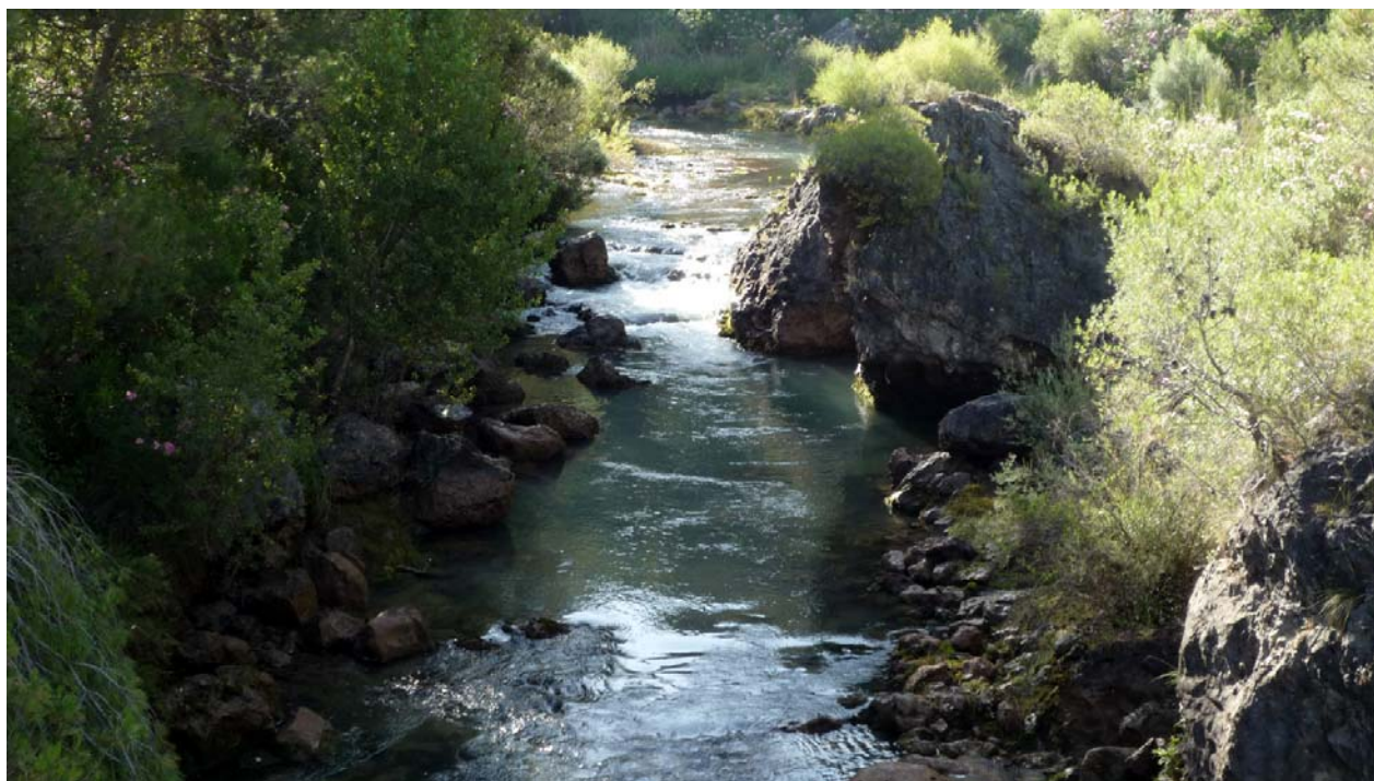
Río Guadalquivir por el Puente Rompecalzas

Curva ascendente a derechas entre los olivos, a la izquierda varios nogales correspondientes al cortijo El Tamborcillo. Continuamos ascendiendo y pronto descubrimos a la izquierda las ruinas del cortijo El Tamborcillo. Continuamos ascendiendo, por la pista esta vez con dirección noroeste, saldrá un carril secundario a la derecha, seguiremos al frente por la pista principal.