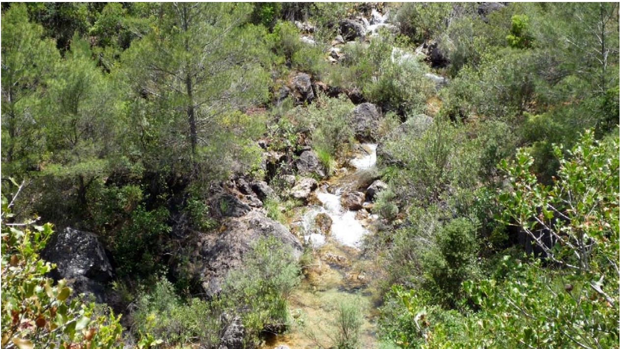
Panorámica Arroyo Chillar

Cuadros que destacan algún punto interesante en la ruta: Sendero de las riberas y las cumbres. Nuestro recorrido por las riberas del Guadalquivir y del arroyo Chillar, permite además de encontrarnos con todo tipo de vegetación ribereña, escuchar la gran cantidad de pequeños pájaros característicos de este hábitat, sobre todo en primavera. Al subir a las inmediaciones de los picos de la Lancha del Pueblo nos encontramos con buitres leonados, ciervos, cabras montesas y magníficas panorámicas.