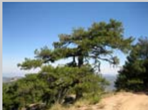
Pino atormentado en Caballo Torraso