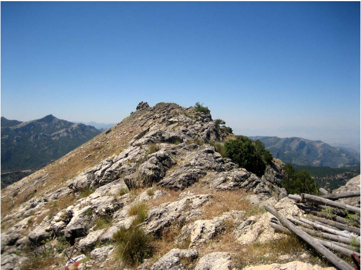
Cumbre Caballo Torraso 1.726 m.

Cuadros que destacan algún punto interesante en la ruta: Entorno de la Casa Forestal Carrales de Abajo con cedros, cipreses, ciruelos, etc, gran quejigo en el aparcamiento al inicio de la ruta. Zona de Carralillos con el gran nogal y la fuente abrevadero. Pino en cruz y vegetación de alta montaña sobre los 1.500 m. de altitud en la zona de Laguna de Carrales. Cruz del Espino con magníficas panorámicas hacia el oeste y Pico Caballo Torraso con impresionantes vistas de toda la sierra.