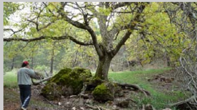
Gran Nogal de Carralillos