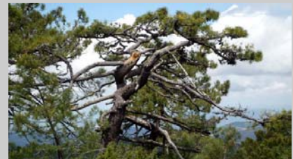
Pino castigado por los vientos en Laguna de Carrales